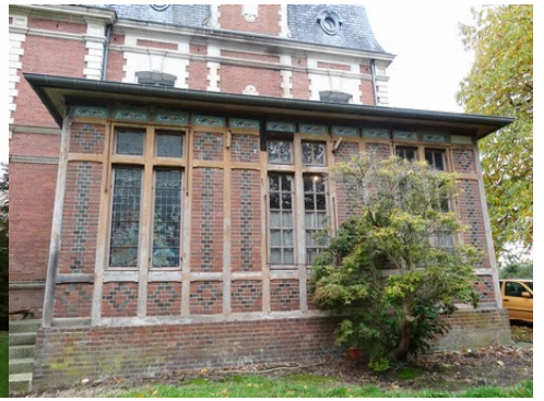
La véranda, accolée à la façade est