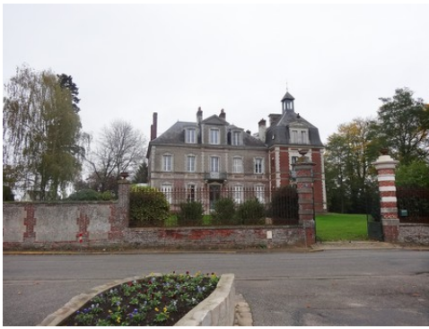
Le château vu de la place au Sud