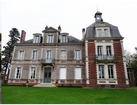
La façade sud du château (vue proche)