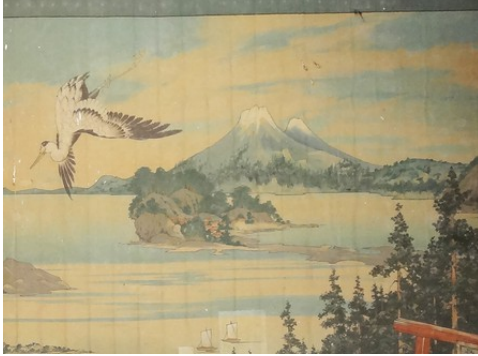
Des détails de toiles peintes