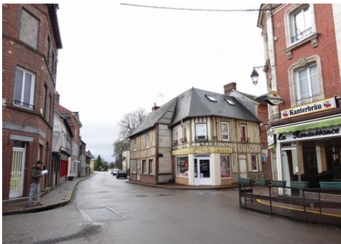
Des maisons à briques et à pans de bois

Les avis seront cohérents avec ceux émis ces derniers années, à savoir : pas de maisons à volume compliqué (type V, W, Y, ou Z), pentes à 45° pour les volumes principaux, ardoise ou tuile plate de teinte brun vieilli, à 20u/m 2 , avec un débord de toiture de 20cm, enduit de teinte beige clair avec modénatures (au choix : chaînages, encadrement de fenêtres, soubassement, colombage...). *Voir les autres fiches.