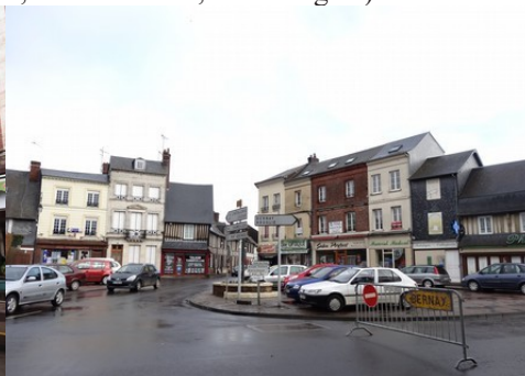
La variété des matériaux en façade