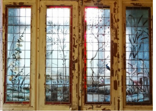
Les vitraux Art Nouveau

Pour la zone en rose foncé dans le périmètre de 500m