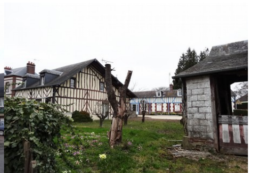
Des constructions à pans de bois